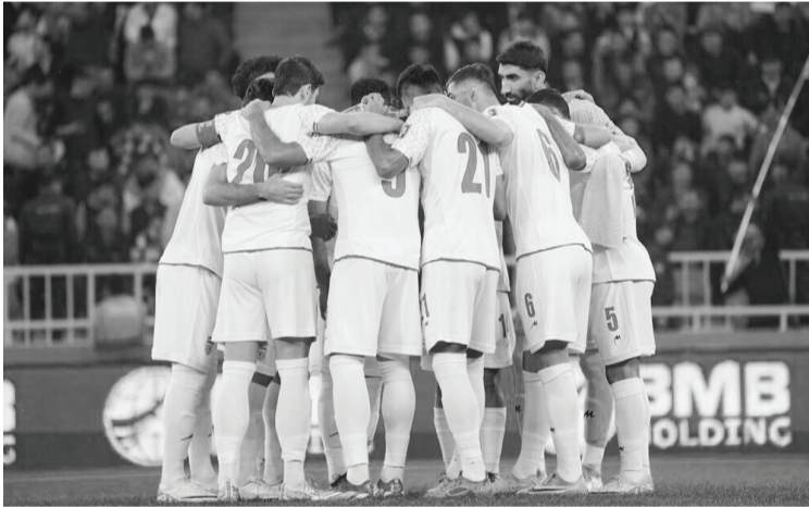
پرسپولیس همچنان بلاتکلیف؛

در جام ملت‌های آسیاست. تیم ملی فوتبال ژاپن رکورددار قهرمانی در این رقابت بزرگ را به دست آورده است. اگر سامورایی‌ها، امپراطور این رقابت‌ها باشند ایران را هم باید با سه قهرمانی به عنوان پادشاه برگزید. ایران در سال‌های ۱۹۶۸ و ۱۹۷۲ و ۱۹۷۶ قهرمان جام ملت‌های آسیا شده است تا نشان دهد تیمی ریشه‌دار در این رقابت‌هاست. تیم ملی فوتبال ایران در ۱۴ دوره از ۱۷ دوره جام ملت‌های آسیا شرکت داشته که این هم یک رکورد است. آنها در ۶۸ بازی خود در این رقابت‌ها ۴۱ بار پیروز شده‌اند که این هم یک رکورد به شمار می‌آید. نکته مهم‌تر درباره ایران اینکه آنها رکورددار کسب امتیاز و گلزنی در جام ملت‌های آسیا هم به شمار می‌آیند.