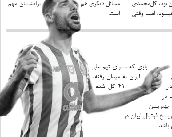
گل‌زنان تاریخ فوتبال ایران در رده چهارم باشد.

باید به هواداران پرسپولیس حق داد که در این روزهای حساس نقل و انتقالات نگران وضعیت تیم محبوب خود باشند؛ چراکه کسانی که ادعای پرسپولیسی بودن داشتند، حداقل در ظاهر نشان دادند به‌جز پرسپو لیس مسائل دیگری هم برایشان مهم است.